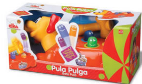
CACHORRO PULA PULGA Item 12