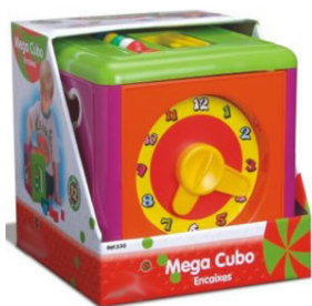
MEGA CUBO Item 19