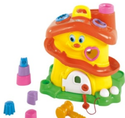
ACTIVITY HOUSE EM SACOLA Item 10