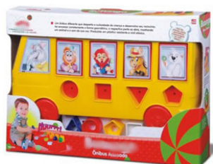
BUSUNGA ÔNIBUS ANIMADO Item 26