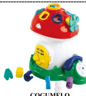
COGUMELO Item 15