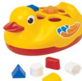
PATO EDUCATIVO Item 21