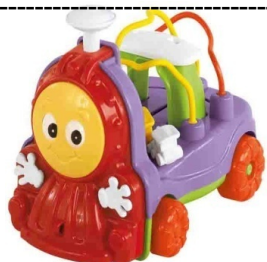
DONKA TREM EM SACOLA Item 16