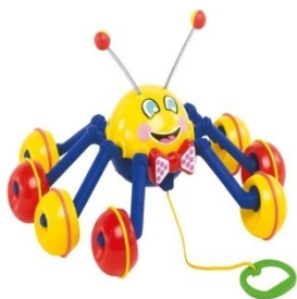
POLVO P/ PUXAR Item 22