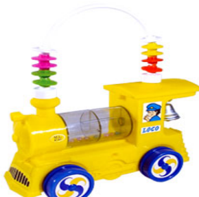
LOCO BABY Item 17