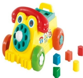
RIVA PHONE Item 23