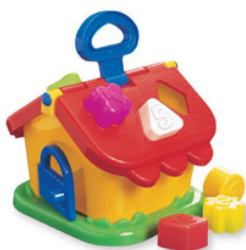
MINHA CASINHA Item 20