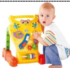
ANDADOR FELIZ PRIMEIROS PASSOS Item 11