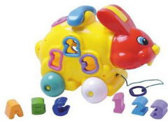
COELHO DIDÁTICO Item 2