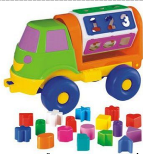
CAMINHÃO SORRISO DIDÁTICO