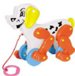
CACHORRO DÁLMATA Item 5