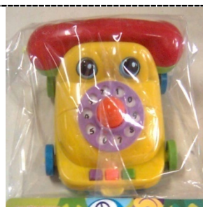
MAX FONE SOL Item 18'