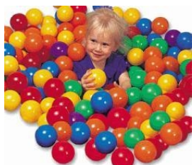
BOLINHAS AVULSAS PARA PISCINA Item 7