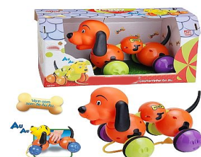
DOGGY CACHORRINHO AU-AU Item 28