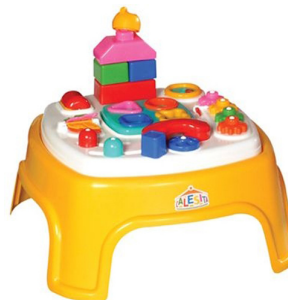
MESINHA ENCANTADA Item 3