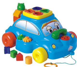
CARRINHO ENCANTADO DIDÁTICO Item 4