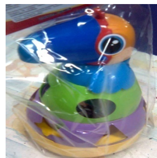
TUCANO DIDÁTICO SOLAPA Item 24