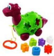
BABY DINHO DIDÁTICO Item 8