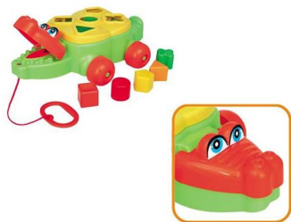
JACARÉ JÚNIOR EM SACOLA Item 1