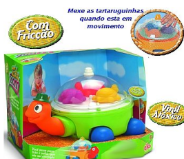
TATA ZOOM Item 29

As imagens dos brinquedos servem apenas de orientação para o tipo pretendido.