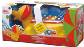
XILOCÃO Item 25