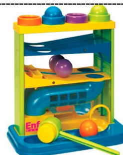
TOBOGÃ ESCORREGADOR COM ESPELHO Item 6