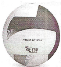
Modelo 020 Volley