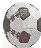
Modelo 023 Handebol Infantil