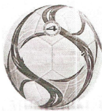
Modelo 014- Campo Infantil