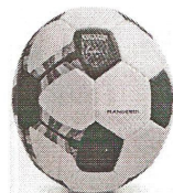
Modelo 022 Handebol Adulto