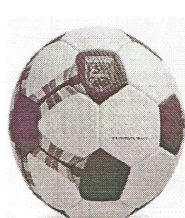
Modelo 021 Handebol Adulto