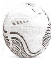
Modelo 018 Futsal