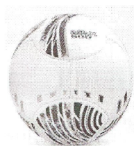
Modelo 015 - Futsal Adulto