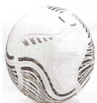
Modelo 017 Futsal