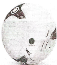
Modelo 013 - Campo Oficial

SECRETARIA MUNICIPAL DE EDUCAÇÃO E CULTURA