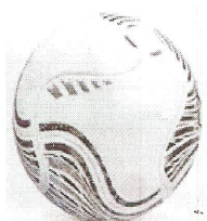
Modelo 016 Futsal